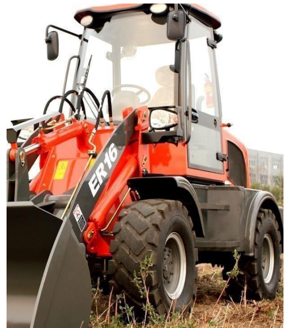
Standarddäck ; 23,5/70-16