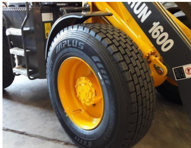
Saipade lastbilsdäck 22,5"

Hög & Lågväxel samt 3 -4 funktion Backkamera mugghållare etc