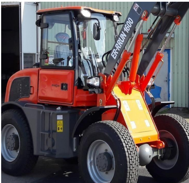
Stora däcken 22,5" Saipade lastbilsdäck